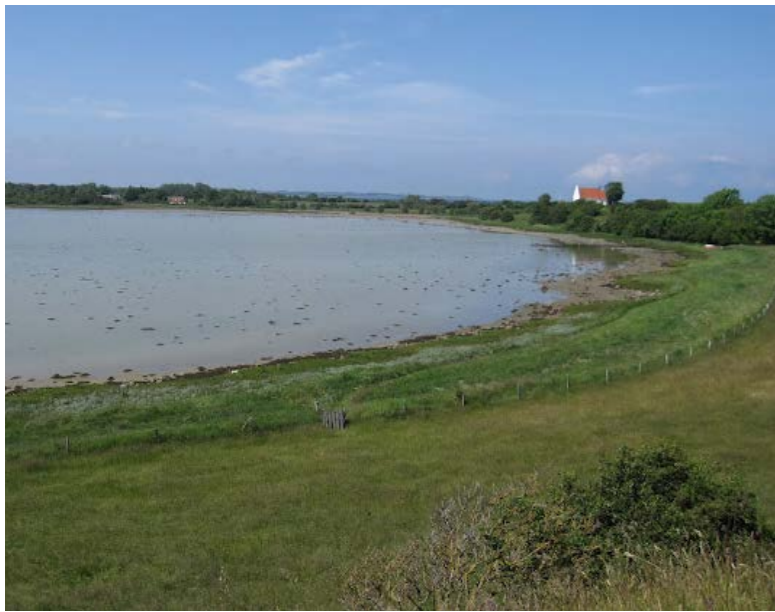
Udsigt til Langør Kirke