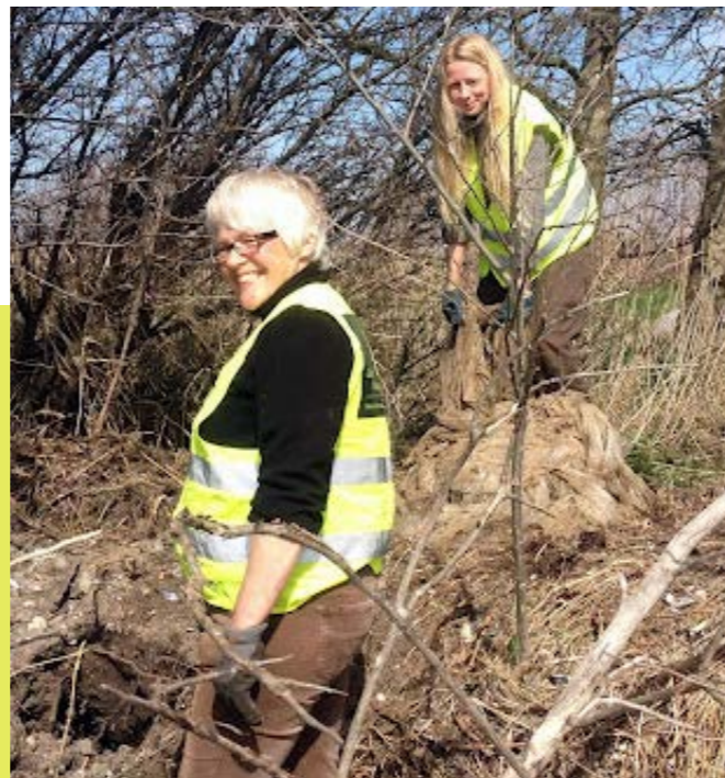
Hvert år arrangerer DN Samsø affaldsindsamling

Danmarks Naturfredningsforenings vision er, at Danmark skal være et bæredygtigt samfund med et smukt og varieret landskab, en rig og mangfoldig natur og et rent og sundt miljø.