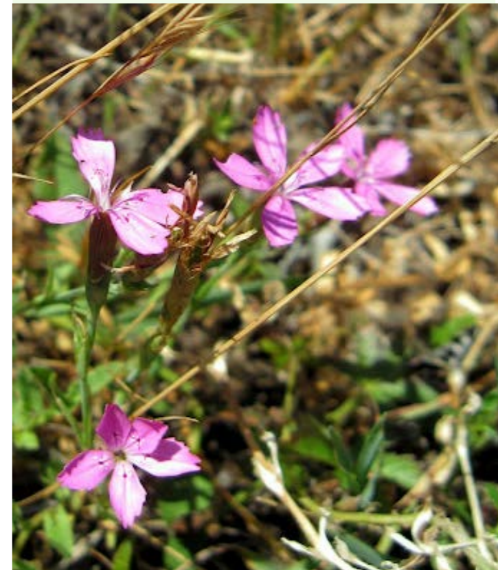
Bakkenellike i Busdalen