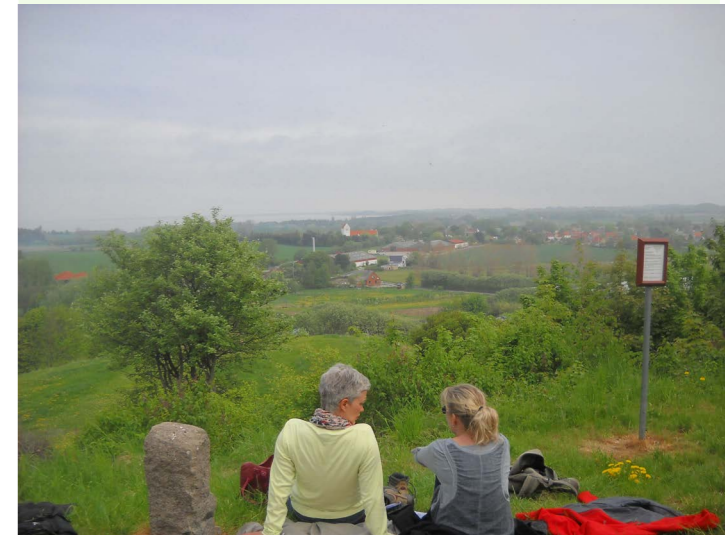
Frokostpause på "Dyret"

I DN Samsø forsøger vi at tage vores arbejde med ud i naturen så meget som muligt. Hvert forår er vi fx med til at arrangere den lokale del af den landsdækkende affaldsindsamling, hvor øens skoler, børnehaver, dagplejer og mange foreninger er med til at holde øen ren. Vi samarbejder også gerne med blandt andet kommunens naturafdeling om ture og aktiviteter i forbindelse med fx Naturens dag og andre nationale og lokale natur – og miljøarrangementer.